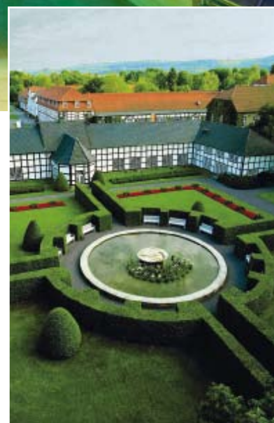
Ein kleiner Ausschnitt des 65 Hektar großen Anwesens mit der dazugehörigen englischen Parkanlage.

Die historischen Gebäude des Anwesens wurden ab 2005 bei laufendem Hotelbetrieb modernisiert, ausgebaut und erweitert. Dabei wurden